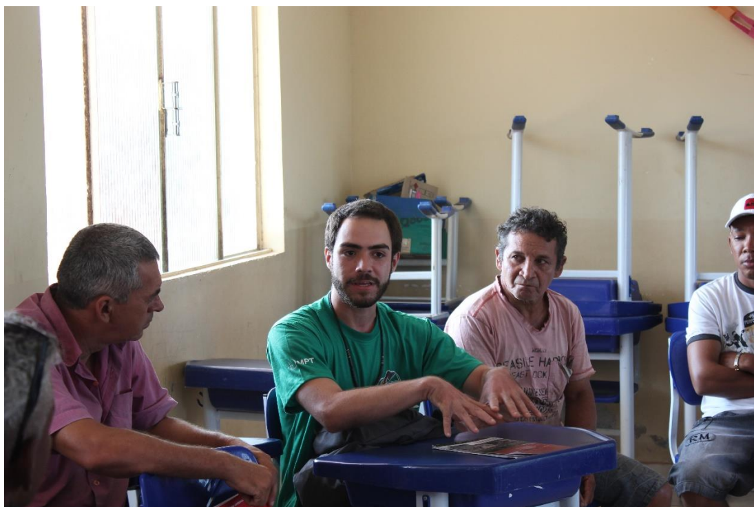
Folkemøte i Vilau Jirau med mennesker påverka av Jirau-utbygginga i Rondonia i Brasil

Fivas har i tillegg til å følge vidare opp Sarawak og Nepal frå 2014, i 2015 og fulgt Jirau-prosjektet i Brasil kor Norsk Veidekke har vore hyra inn som underleverandør.