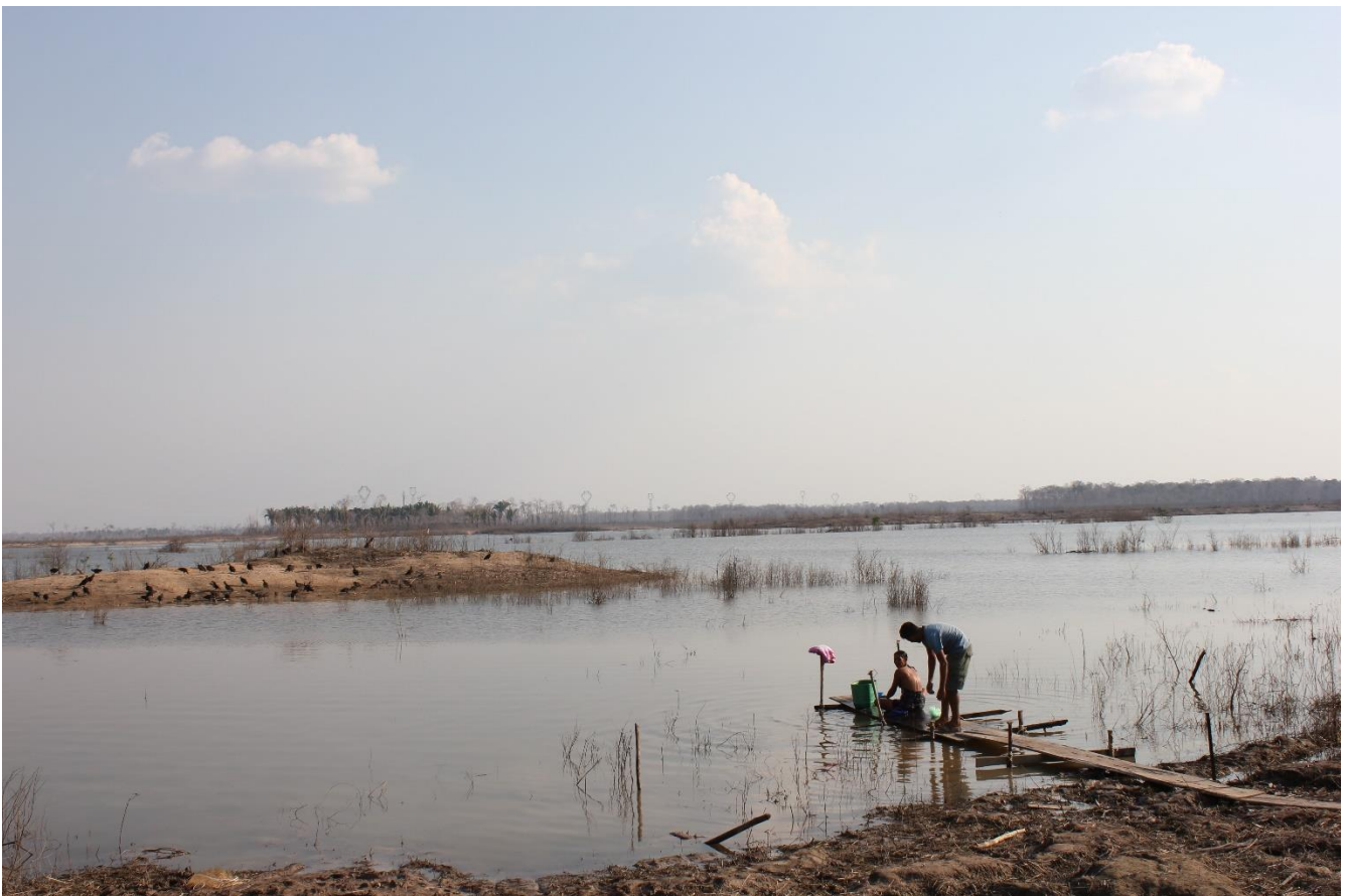
Fiskarar påverka av Jirau-utbygginga i Mutum i Rondonia, Brasil