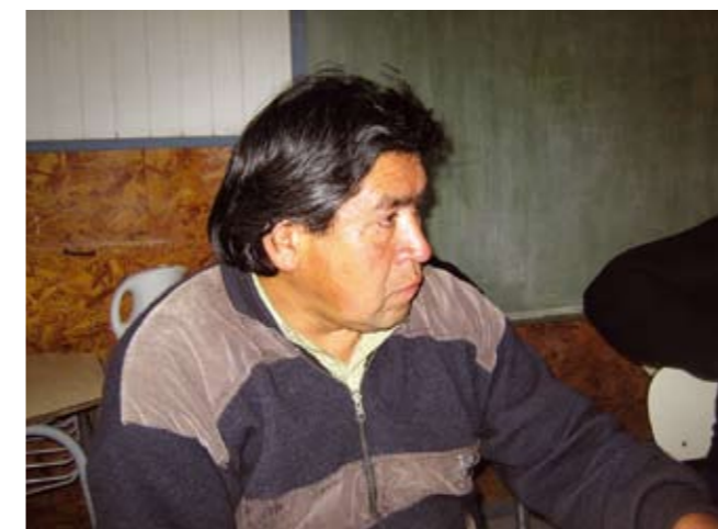
Medlem av Newen Mapu-komiteen i møte med forfatter, mai 2007.

Samfunnene har et ønske om å gjennomføre alternative undersøkelser og å skaffe kvalifiserte konsulenter for å få til en prosess med større likevekt mellom partene. Men de uttrykker bekymring for at alle de økonomiske ressurser og politiske kontakter som selskapet har gir selskapet mye større handlingsrom og makt enn det de har mulighet for å tilegne seg. Selv har de knapt økonomi til å skaffe egne representanter og gjennomføre egne undersøkelser som kan gjøre rede for og systematisere samfunnenes situasjon og deres rettigheter.