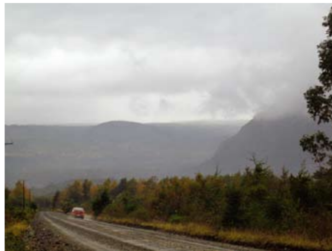
Hovedveien til Coñaripe, Panguipulli, X Region, Chile.

Rapporten søker også å gjøre rede for bakgrunnen for problematikken, og går i denne forbindelse gjennom den territoriale og juridiske situasjonen som Mapuche-indianerne i Coñaripe befinner seg i, samt urbefolkningenes internasjonalt anerkjente rettigheter, spesielt ILO-konvensjon 169. Dette gir et bedre grunnlag for å fastslå hvilke rettigheter Mapuche-indianerne som urfolk har og hvilke rettigheter det er konflikt om i denne konkrete saken.