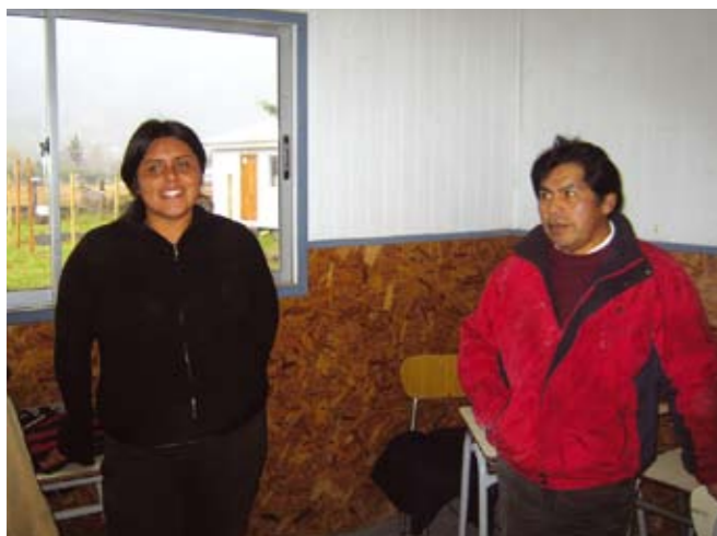
Medlemmer av Newen Mapu-komiteen, fra Mapuche-samfunnene i Coñaripe.