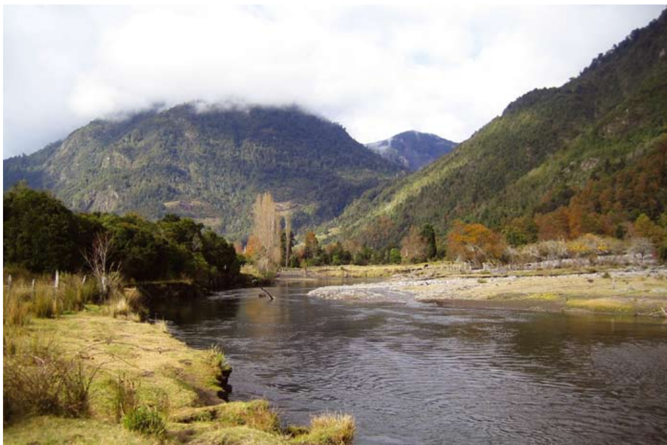
Llancahue-elven i Coñaripe (over), en av elvene som blir berørt av SN Powers vannkraftprosjekt. Et gammelt Mapuche gravsted (til venstre) hvor det ligger restene av viktige forfedre.