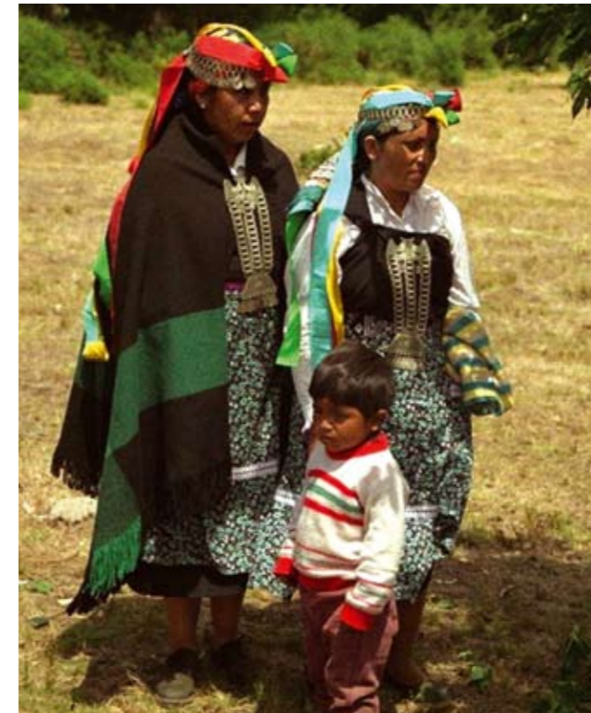
Mapuche-kvinner i tradisjonell dress.

På bakgrunn av de ovennevnte omstendigheter er i dag forholdet mellom den chilenske staten og Mapuche-folket svært konfliktfylt og preget av Mapuche-organisasjonenes og befolkningens vedvarende kamp for respekt og anerkjennelse av deres territoriale, kulturelle, sosiale og økonomiske rettigheter, som per i dag ikke er anerkjent i den chilenske grunnlov. Den chilenske stat har heller ikke ratifisert de internasjonale retningslinjene for beskyttelse av urbefolkningene på tross av tallrike anbefalinger fra internasjonale organisasjoner. 15 Juridisk har Mapuchene i Chile bare status som befolkning, og store deler av statens urbefolkningspolitikk består kun av sosiale hjelpetiltak, og dreier seg ikke om deres kollektive rettigheter som helhet slik ILO-konvensjonen krever.