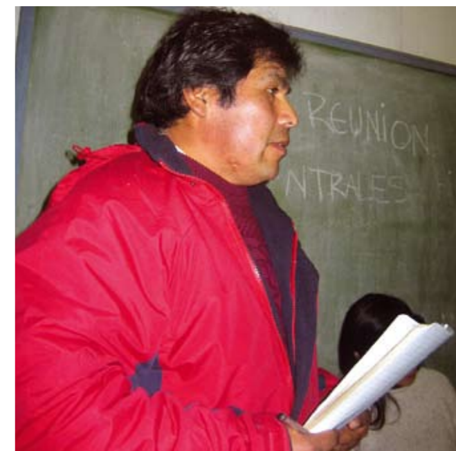
Medlem av Newen Mapu-komiteen på en informasjonsmøte med Mapuchesamfunnene, mai 2007.

I området Coñaripe finnes det diverse aktører som har ulike interesser og i mange tilfeller er det konflikter rundt hvem som skal representere disse interessene. Samfunnene i Coñaripe uttrykker bekymring for at de ikke får den samme informasjon som de andre aktørene har fått i møter med SN Power. Newen Mapu-komiteen