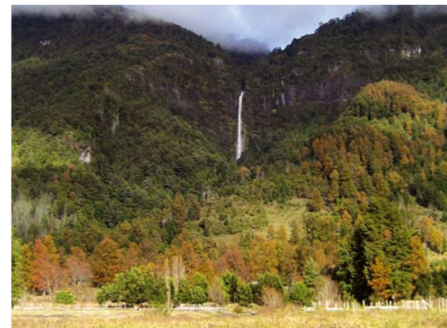
Trayenko. Fossen har spesielle religiøse betydninger for Mapuche-folket.

« ...prosessen har skapt en “de facto”-situasjon når det gjelder realiseringen av damanleggene. »