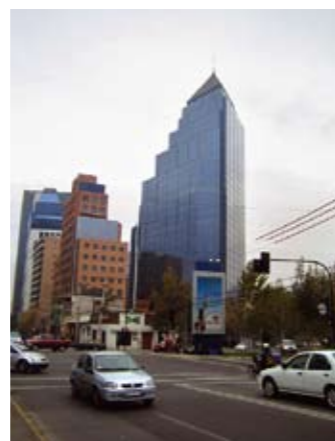
Santiago, Chile. Modernitet og behov for energi.

Chile er derfor et interessant nytt marked for utvikling av vannkraft og et naturlig investeringsmarked for SN Power. SN Power har tidligere deltatt sammen med det australske selskapet Hydro Pacific i et vannkraftprosjekt i VI region Tinguiririca.