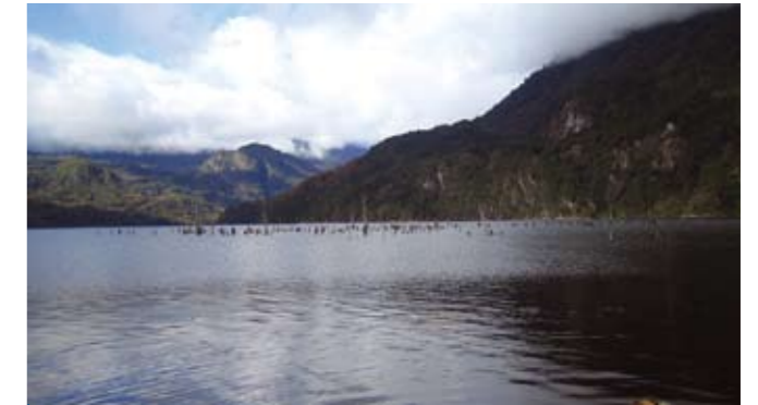
Pellaifa-innsjøen i Coñaripe. Mapuchesamfunnene i området har stor respekt for denne innsjøen.

fordelene er marginale når mesteparten av vannkraftressursene blir ført ut av området og det ikke finnes politiske mekanismer som gjør at noen av ressursene og godene som kraftproduksjonen medfører blir igjen i området på permanent basis.