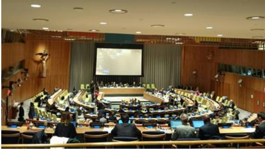
Frå dei uformelle sesjonane om Finansering for utvikling i FN i New York i november

På haustparten har vi jobba både i nasjonale og internasjonale nettverk med Finansering for utvikling-prosessen som skal leie fram til eit toppmøte i Addis Abeba i juli 2015. Vi har haldt tett kontakt med eit internasjonalt nettverk av sivilsamfunnsorganisasjonar både gjennom å reise og delta på møter i New York og Paris og via epostlister. I Noreg har vi delteke i den ForUM-koordinerte FFD-innsatsen.