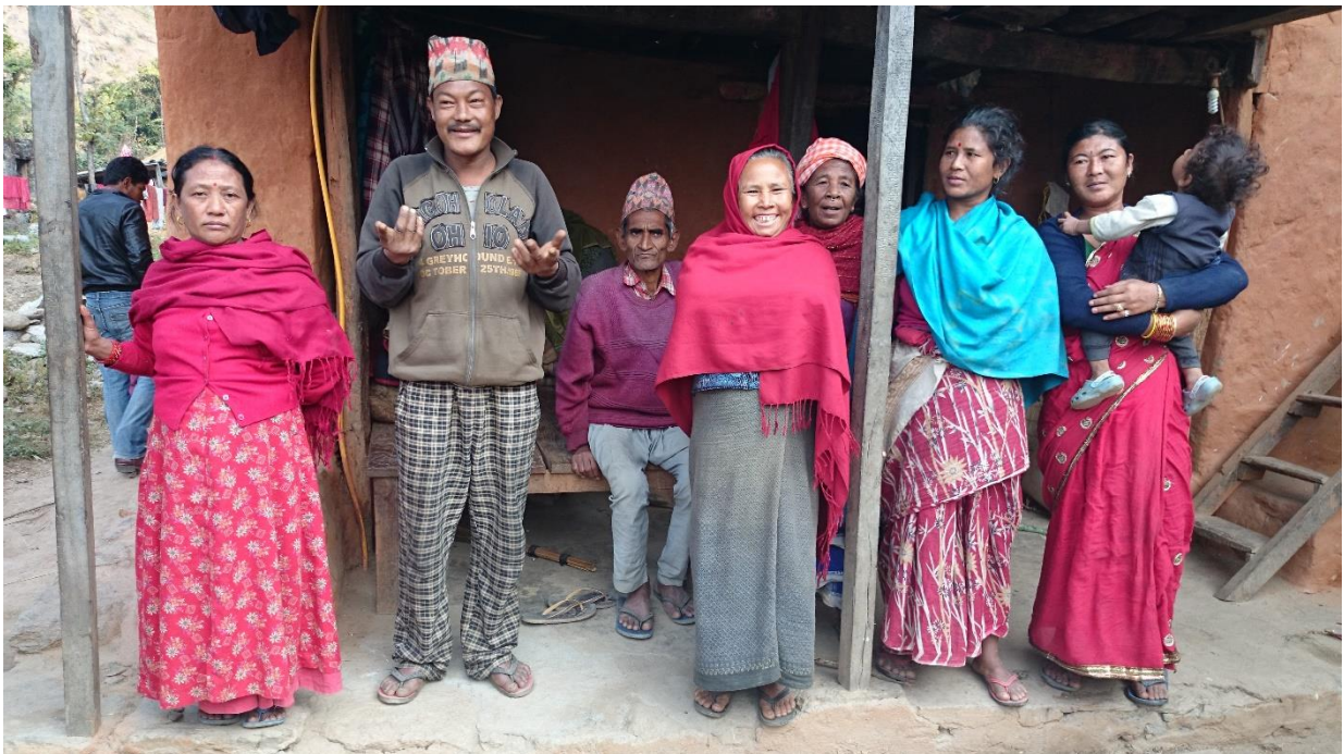
Fiskarar frá Magi-folket i Khimti i Nepal som bur i nærleiken av Statkraft sitt Khimti-anlegg