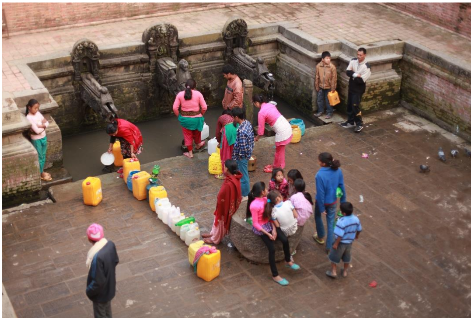
Nepalesarar som hentar vatn ved Durbar square i Kathmandu

I samarbeid med den nepalesiske sivilsamfunnsorganisasjonen Jal Sarokar besøkte vi Khimti-anlegget og omkringliggende landsbyar. Vi besøkte og området kor Statkraft planlegg å bygge ut Tamakoshi 3 og prata med innbyggjarar i landsbyar som vil verte oversvømd dersom dammen vert bygd ut. Vi besøkte og Upper Tamakoshi som kinesiske Sinohydro no bygger ut på den øvre delen av Tamakoshi-elva. Vidare besøkte vi Sunkoshi-dammen som vart øydelagd av eit jordskred i august 2014 og Botakoshi-dammen. Avslutningsvis besøkte vi Melamchi-området. Frå Melamchi-elva vert det for tida bygd ein kanal til hovudstaden Kathmandu for å sende drikkevatt til Kathmandu. Der intervjuja vi bønder og lokale som driv med fiskeanlegg som vil verte råka dersom vatnet i elva deira forsvinn.