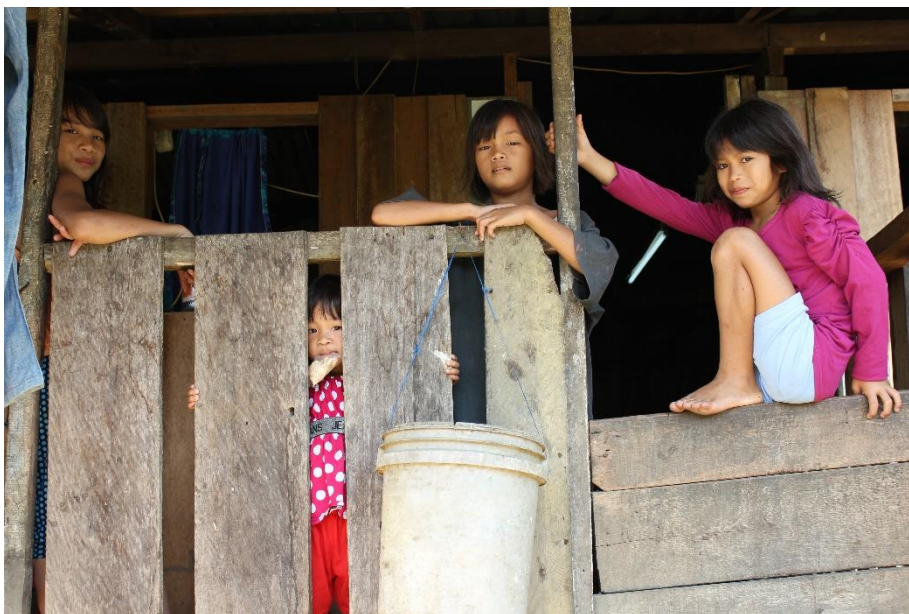
Penan-jenter i Sarawak mars 2014

Nettsidene våre har hatt eit nokså jamnt besøk gjennom året. Vi har tydeleg auke dei første dagane etter at vi sender ut nyheitsbrev. Vi har fulgt besøkstala gjennom bruk av analyseverktøyet Google Analytics og sosiale media gjennom Klout. I løpet av 2013 har vi hatt 12 609 besøk på nettsidene, ein oppgang på 500 frå i 2013. 9993 har vore unike brukarar, ein auke på kring 1800 frå året før. Vi har hatt 21 818 sidevisningar, noko som er ein nedgong på kring 3000 frå 2013.