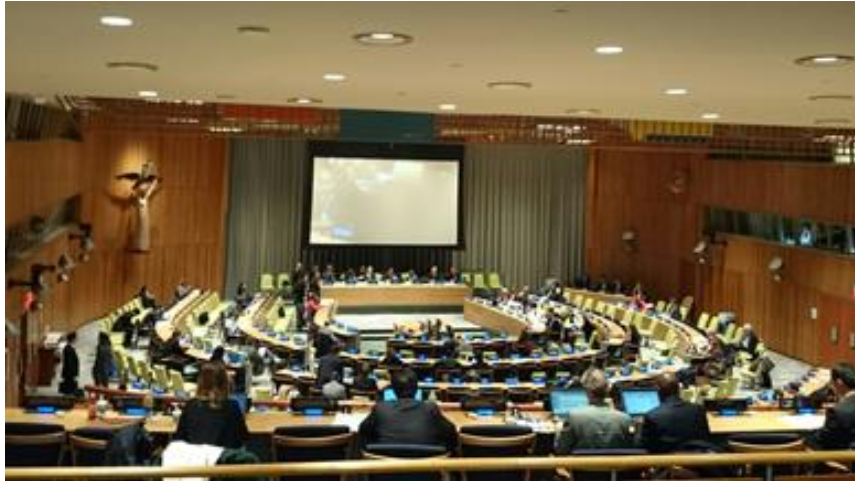
Frå dei uformelle sesjonane om Finansering for utvikling i FN i New York i november

På haustparten har vi jobba både i nasjonale og internasjonale nettverk med Finansering for utvikling-prosessen som skal leie fram til eit toppmøte i Addis Abeba i juli 2015. Vi har haldt tett kontakt med eit internasjonalt nettverk av sivilsamfunnsorganisasjonar både gjennom å reise og delta på møter i New York og Paris og via epostlister. I Noreg har vi delteke i den ForUM-koordinerte FFD-innsatsen.